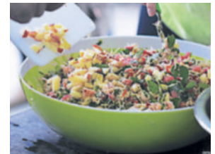
Unas 30,000 personas han aprendido a no desperdiciar los alimentos.