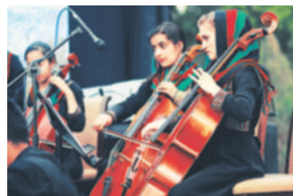
Una grupo de 30 niñas de 12 a 21 años conforman la orquesta.