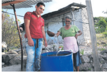
Un muchacho ayuda a acarrear el agua a una señora en la aldea Pajarillos. Los líderes de 12 a 18 años desarrollan actividades en beneficio de sus comunidades.