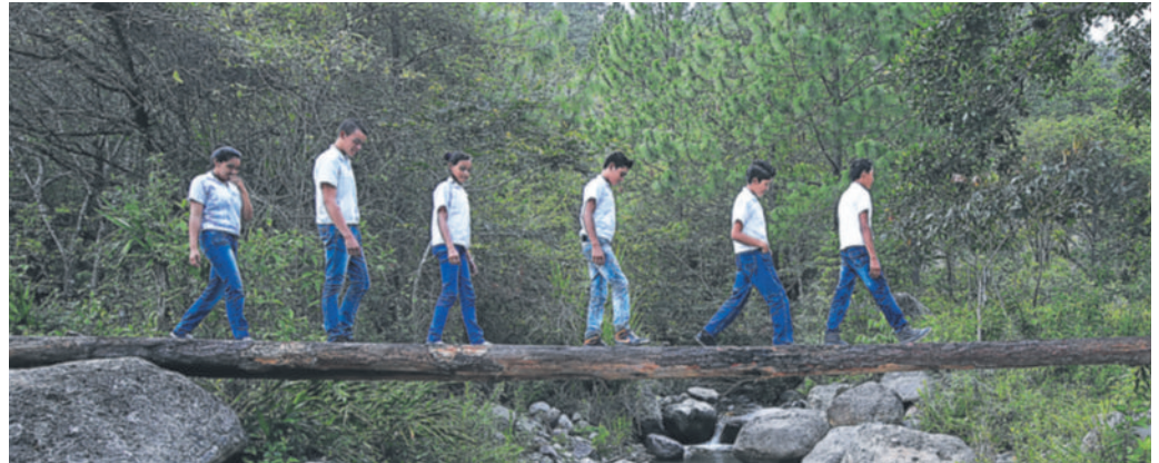
Antes los niños debían sortear todo tipo de obstáculos para cursar estudios secundarios, hoy tienen una meta y no están dispuestos a abandonar la escuela.

Campañas de prevención de enfermedades como dengue, zika y chikungunya, así como charlas a niñas para la prevención de embarazos, obras de infraestructura, tutorías a es-