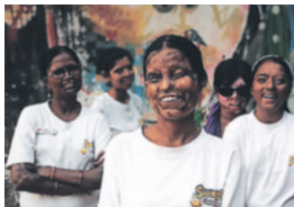
Las sobrevivientes. Sheroos les ha cambiado la vida gracias a la campaña Stop Acid Attacks.