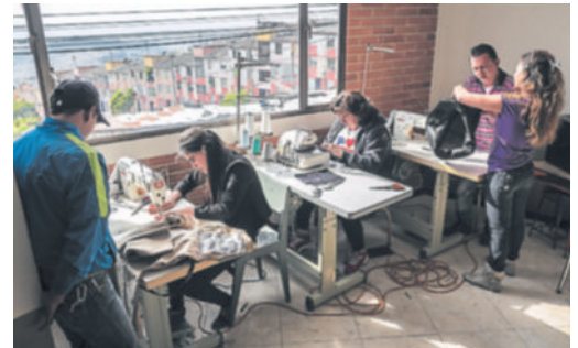
Las mujeres se forman en confección textil. La mayoría llegan del interior del país, huyendo de la violencia.