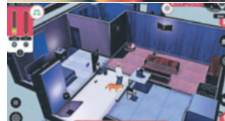
La aplicación permite a los usuarios interiorizar nociones sobre el consumo energético y el costo financiero sus acciones.

variable. "Ahora mismo estamos recopilando y analizando los primeros resultados y podemos concluir que en los tres primeros meses ha habido una reducción del 7% en el consumo, pero son datos muy preliminares", asegura Miquel Casals, coordinador de la investigación.