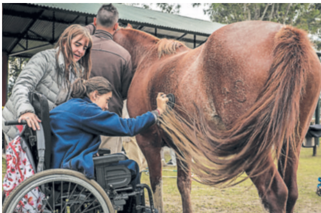
Una joven con discapacidad es sometida a un tratamiento en la Fundación de Equinoterapia del Azul en Salta, Argentina. En ese país funcionan 250 escuelas que aplican esta técnica.