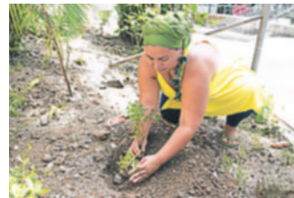
Regina le enseña a la gente a cultivar sus propias verduras.