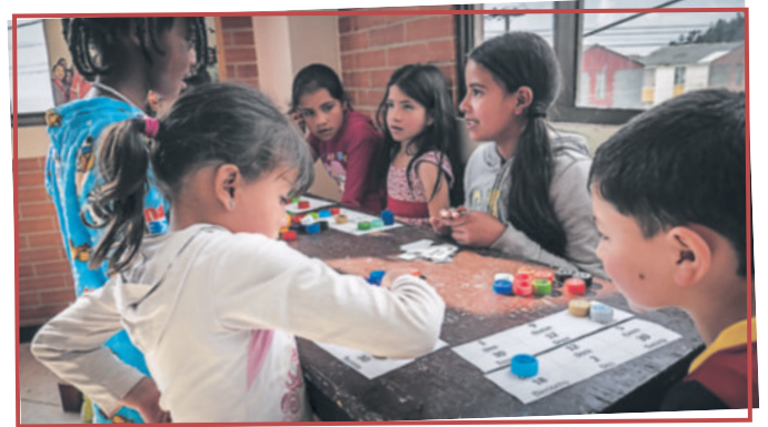
Los niños son los mayores afectados por la guerra y la violencia. En el Centro COMParte se les integra a diversas actividades.