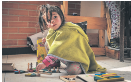
Esta pequeña no parece consciente de lo que ocurre a su alrededor, es una de los centenares de desplazados.

“En diciembre de 2005 recibí la última de varias amenazas que me hicieron. Me decían que debía irme por culpa de la labor social que hacía y me tocó dejarlo todo. Llegué a Bogotá a empezar de cero”, contó, al tiempo que reconoció que las advertencias contra su vida pro-