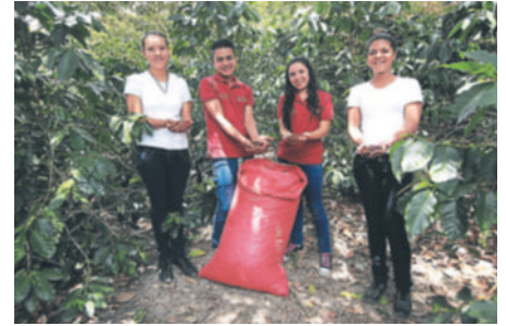
Los jóvenes y sus familias crearon Adelante Coffee, una marca de café, producido por ellos, que es vendida en Estados Unidos gracias a la gestión de E2E.